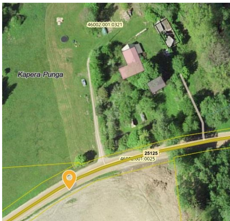
Joonis 1. Bussipeatuse asukoht riigitee nr 25125 km 0,8 (paremal pool), väljavõte Maa-ameti geoportaalist

Käesolev otsus jõustub teatavakstegemisest. Otsuse kohta on võimalik esitada meile vaie (Transpordiamet, Valge 4/1, 11413 Tallinn, maantee@transpordiamet.ee ) haldusmenetluse seaduses või kaebus halduskohtule halduskohtumenetluse seadustikus sätestatud korras 30 päeva jooksul.